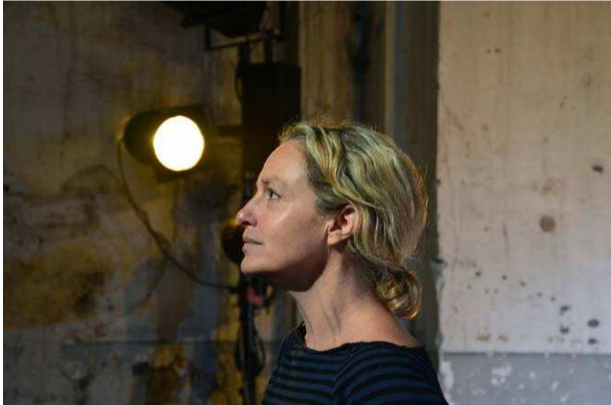
Irina Brook

Directrice du Centre Dramatique National Nice-Côte d'Azur depuis le 1 er janvier 2014, Irina Brook place son travail sous le signe de la fête et du partage. ( La Terrasse , 31 août 2014 - N° 223).