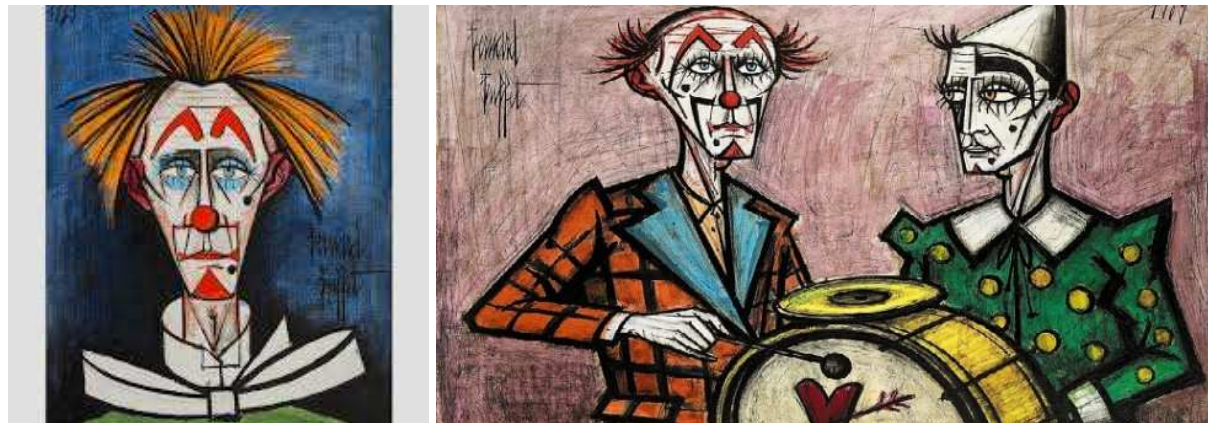
Toiles de Bernard Buffet

> Voici un exercice inspiré des écrits de Jacques Lecoq 1 sur les bouffons. Il te permettra de te mettre progressivement dans la peau d'un clown :